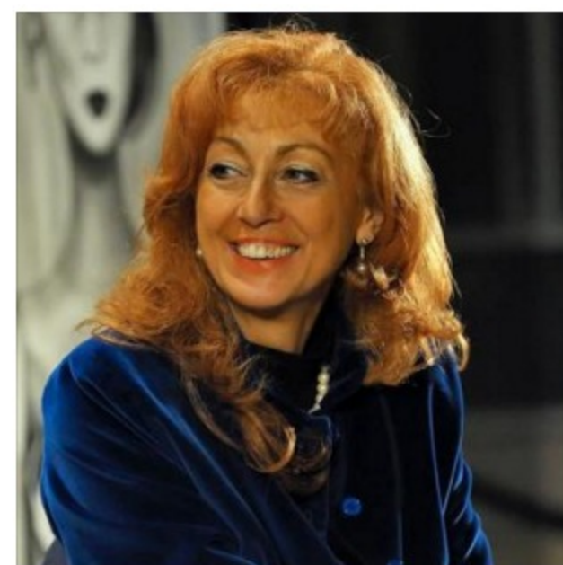
Torino, lunedì 14 marzo concerto alle Nuove Petites soirées