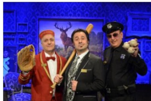
Venaria (TO) - Al Teatro della Concordia il nuovo spettacolo di Mr Forest